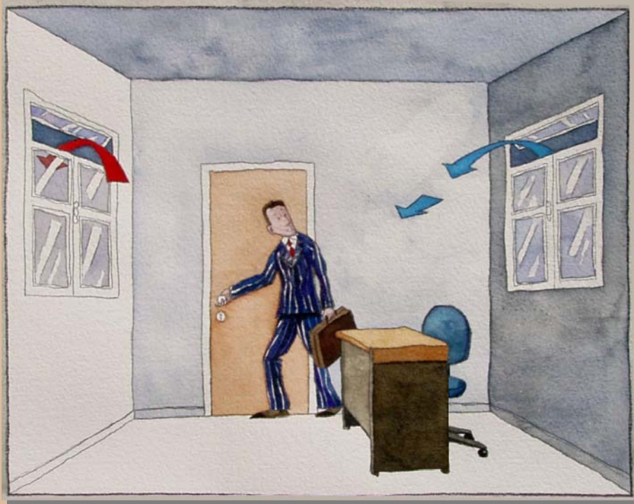
Reduzierung des Kühlenergiebedarfs durch Nachtlüftung (NL)