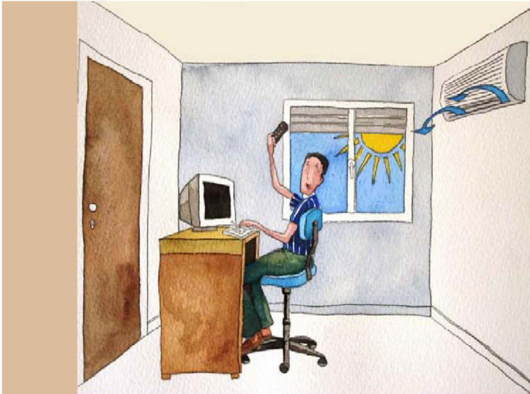
Energijos sutaupymas biuruose užtemdant langus