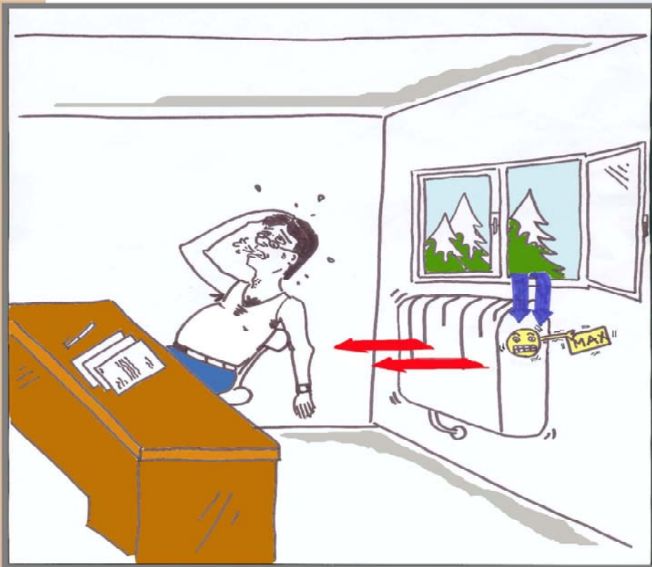
Spotřeba tepla na vytápění běžného kancelářského prostoru